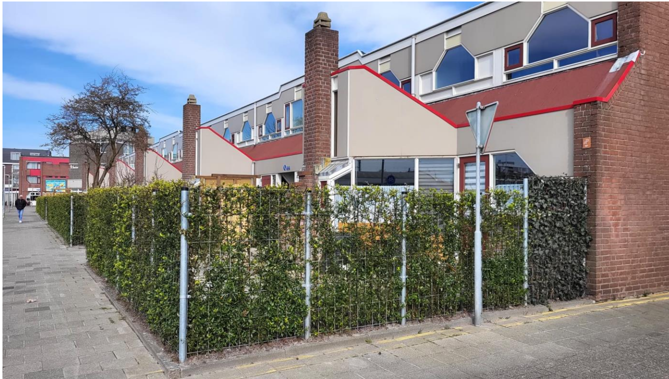
Voorbeeld erfafscheidingen aan Basstraat/Parallelweg